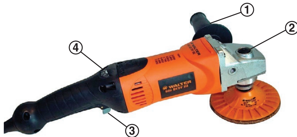
ILUSTRACIÓN DEL MODELO